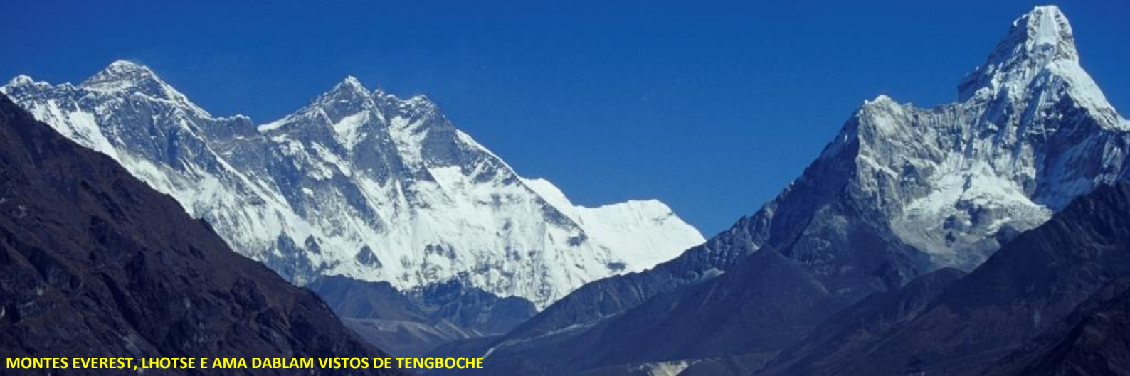
MONTES EVEREST, LHOTSE E AMA DABLAM VISTOS DE TENGBOCHE