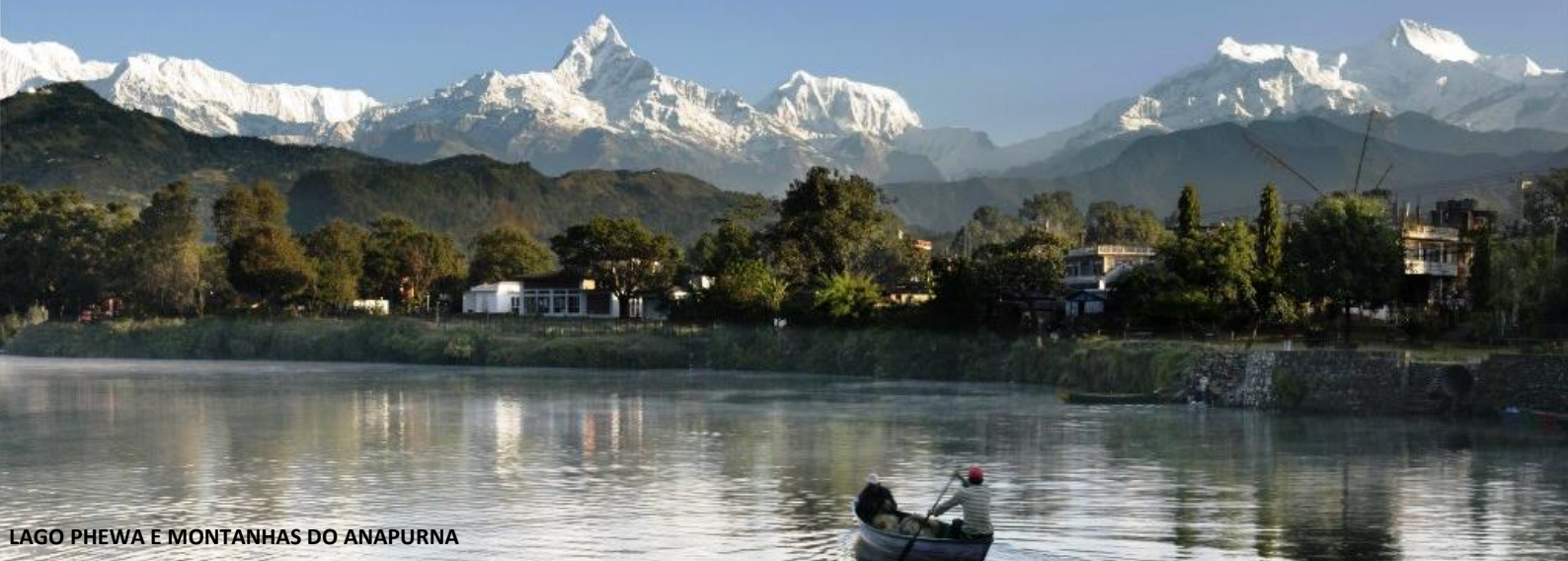
LAGO PHEWA E MONTANHAS DO ANAPURNA