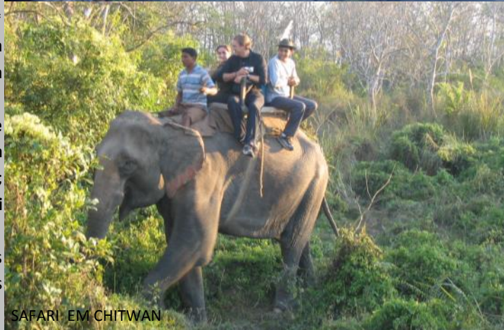
SAFARI EM CHITWAN