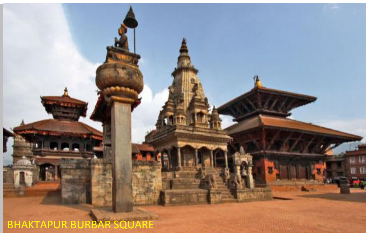
BHAKTAPUR DURBAR SQUARE

Destino por excelência dos alpinistas e montanhistas, o Nepal tem 8 dos 14 picos com mais de 8000 m de altitude. Para quem gosta de fazer Trekking , palavra de origem sul-africana que significa seguir um trilho e fazê-lo a pé, este é o melhor local para fazê-lo, com um guia, de aldeia em aldeia, com vistas deslumbrantes sobre os Himalaias. Existem percursos de trekking de 2 a 18/20 dias, com vários graus de dificuldade.