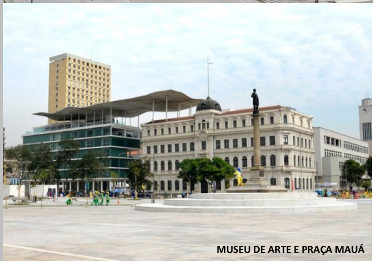
MUSEU DE ARTE E PRAÇA MAUÁ