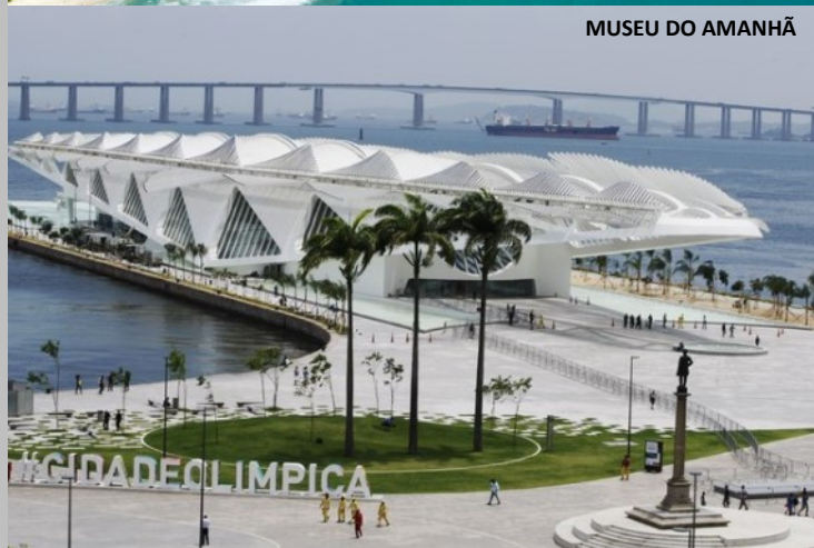
MUSEU DO AMANHÃ