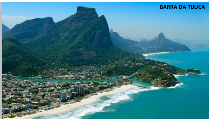
BARRA DA TIJUCA